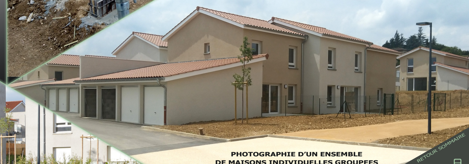
PHOTOGRAPHIE D'UN ENSEMBLE DE MAISONS INDIVIDUELLES GROUPEES