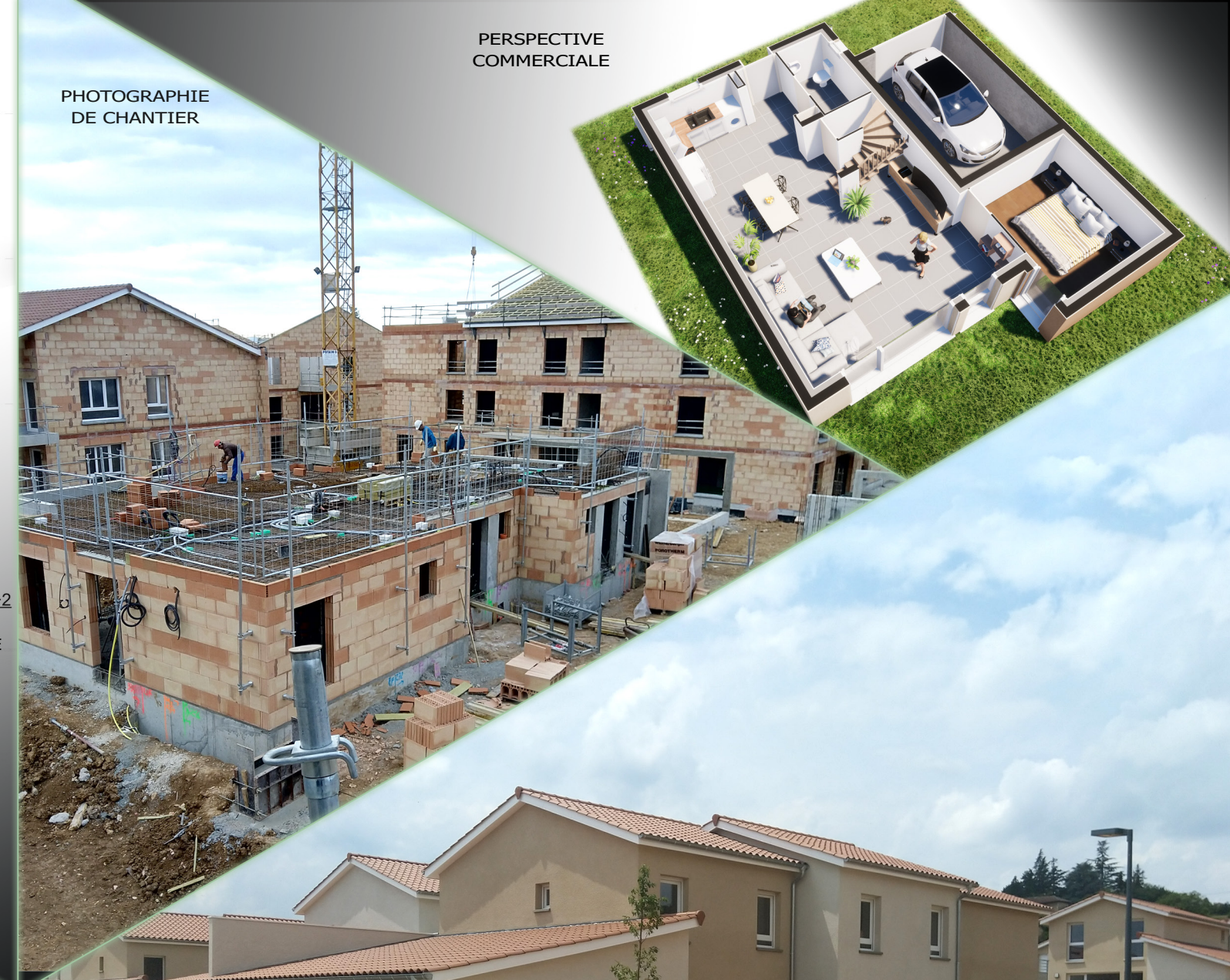
PHOTOGRAPHIE DE CHANTIER