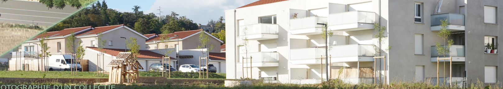
PHOTOGRAPHIE D'UN COLLECTIF